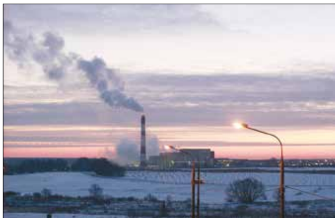
Дым из трубы МСЗ-4 приносит жителям неприятные и вредные для здоровья запахи