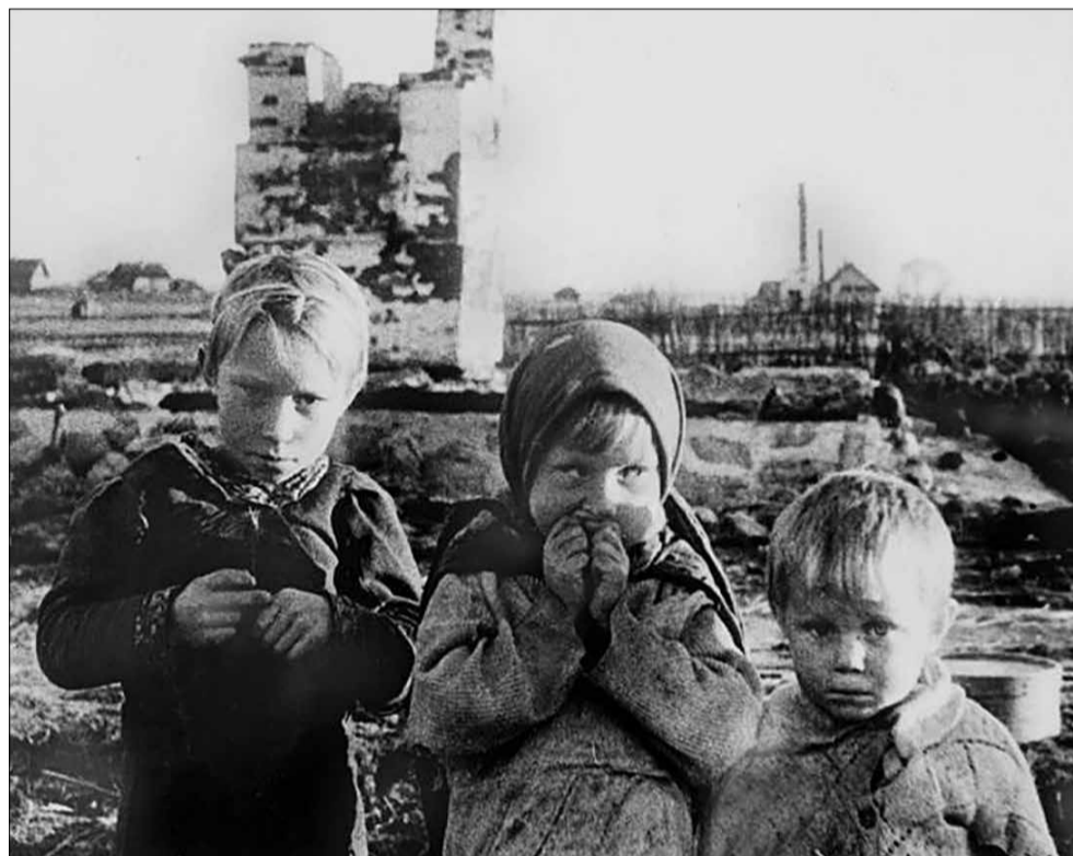
Деревня Лозоватка, Белоруссия, 1944 год

“Дети войны не играли в игры. Они знали изнурительный труд, голод, холод. В 1941 году за 2 месяца были перевезены 6 тысяч предприятий из од-