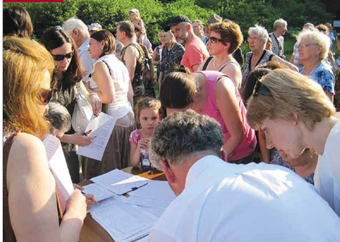
Сбор подписей против строительства транспортно-пересадочных узлов и магистрали на Измайловском проспекте