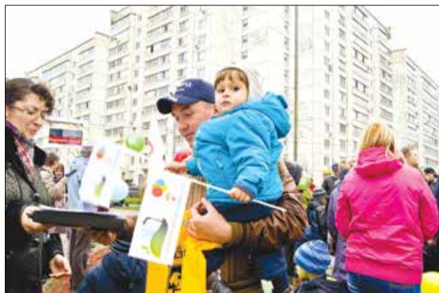
Митинг 27 октября 2013 г. "За чистый воздух, против создания промзоны "Руднево"