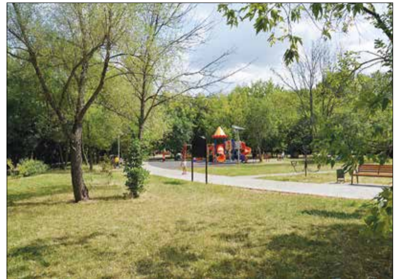
Сегодня пешеходная зона на Измайловском проспекте, завтра пересадочный узел