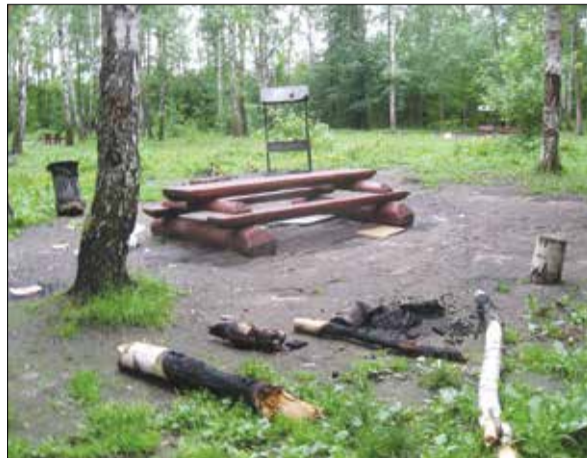
«Пикниковая точка» в Восточном Измайлово

Неужели Департамент природопользования Москвы, который и готовил данную поправку в закон, не в курсе, что дым от мангалов птицы