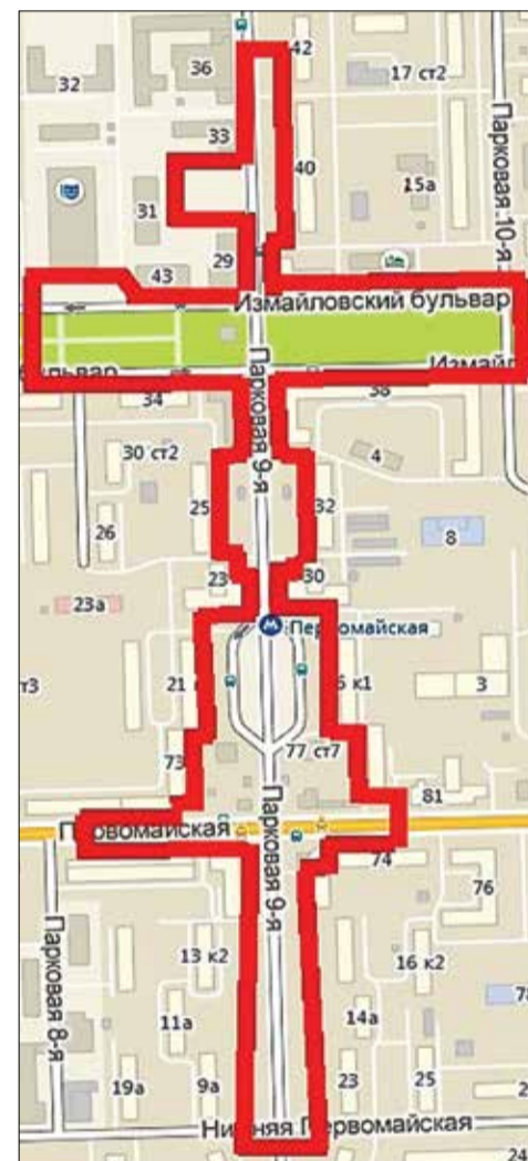
Границы ТПУ у метро «Первомайская»

3. Отказаться от разработки и утверждения проектов планировки для строительства ТПУ у метро «Измайловская» и «Первомайская».