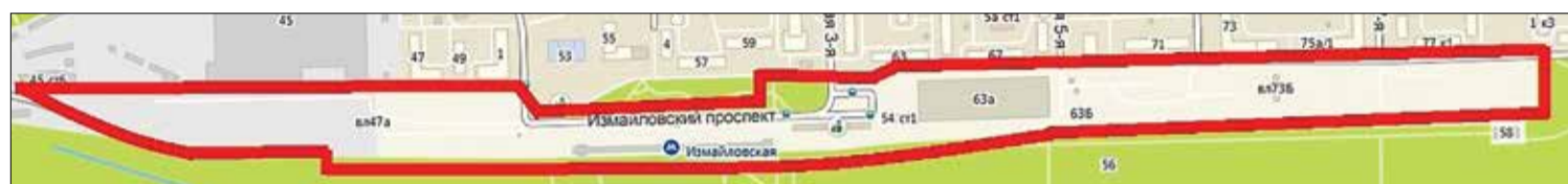
Границы ТПУ у метро «Измайловская».

Кроме того, запланирован снос торгового комплекса «Измайловская ярмарка», в котором покупают продукты питания несколько тысяч москвичей.