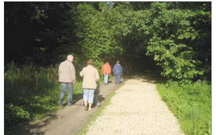
Дорожки, которые приходится обходить

Осенью 2013 года, в Восточном Измайлово, в 39–40-м кварталах лесопарка – это территория, ограниченная Первомайским проездом, 16-й Парковой улицей и совхозом декоративного цветоводства, был реализован проект «Ремонт дорожно-тропиночной сети на территории ПИП «Измайлово», кварталы 39–42». Заказчиком этого ремонта выступила Дирекция по реализации проектов в области экологии и лесоводства Департамента природопользования и охраны окружающей среды г. Москвы (ДПиООС). Стоимость проекта составила 20 000 000 рублей. С самого начала ремонта жители выражали крайнюю озабоченность качеством проводимых работ. Даже останавливали эти работы до встречи с представителями ГПБУ «Управление ООПТ по ВАО», балансодержателем территории. Чиновники заверяли: качество работ будет соответствовать техническому заданию проекта и позволит жителям с комфортом пользоваться дорожками любимого лесопарка.