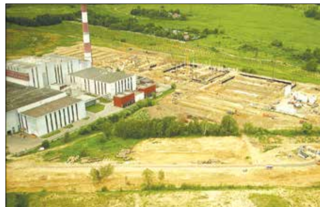
Строительство в промзоне Руднево происходит без утвержденного проекта промзоны, без публичных слушаний. Июнь 2014 г.

Десять лет назад московские власти приняли решение построить новый жилой район Кожухово у восточной границы Москвы. У нового района оказались опасные соседи: объекты первого (высшего) класса экологической опасности. Ближайшие из них – два завода ГУП "Экотехпром": мусоросжигательный завод №4, сжигающий 254 000 тонн твердых бытовых отходов в год, 700 тонн мусора в день), ветеринарно-санитарный завод "Эколог", как бы в издевку над жителями названный так. На "Эколог" сжигают 1 800 тонн биологически опасных и инфицированных отходов в год: конфискованное и просроченное мясо, зараженные опасными болезнями, в том числе сибирской язвой, туши животных, просроченные медикаменты, медицинские одноразовые шприцы, системы и т.д.. А еще рядом – Люберецкие очистные сооружения, две свалки Торбеево и Кучино, крематорий Николо-Архангельского кладбища, промышленные предприятия..