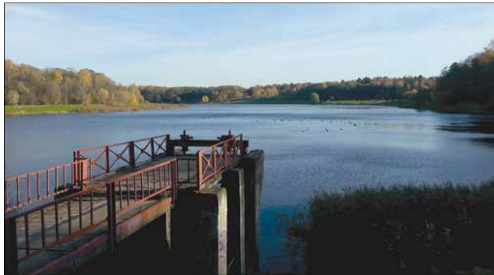
Закат на Лебедянском пруду

У властей периодически возникают мысли благоустроить Лебедянский пруд и окрестные территории, которые находятся в Измайловском лесопарке. Люди забывают, что за таким «благоустройством» обычно идет увеличение антропогенных нагрузок, т.е. увеличивается количество людей, регулярно посещающих данную территорию. Увеличение антропогенных нагрузок на живую природу запрещено законом, у Измайловского парка статусы «особо охраняемая природная территория» (ООПТ) и «природно-исторический парк» (ПИП), любая деятельность там регулируется природоохранными законами и законами, охраняющими памятники истории и культуры. Мы знаем, что после увеличения антропогенных нагрузок территория часто передается в Департамент культуры Москвы, который развивает ее как парк культуры и отдыха (ПКиО) с соответствующими постоянными культурно-досуговыми мероприятиями, что опять же увеличивает поток людей на эти территории (и совсем не местных жителей!). В ВАО мы эту схему видели на примере Измайловского острова и Терлецкого парка. Например, зону отдыха Терлецкого парка (Терлецкой дубравы) благоустроили в 2000-е, а затем эта зона отдыха перешла в распоряжение ПКиО «Перовский» в 2014 г. Что такое ПКиО для местных жителей, лучше все-